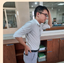
Xoay vai để móc ví