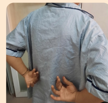
Đưa tay ra sau để gài áo ngực khó khăn