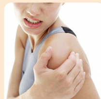
Xoay vai để gãi